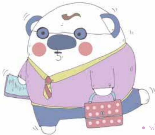
● พ่อแพน パンパパ

パパ、パパはどうしたら幸せになれると思う? パパの場合はたくさん仕事して、優秀社員賞をもらった時だね。 すごく幸せだったよ。