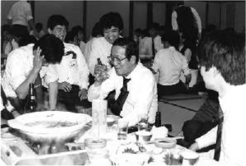
ห้องญี่ปุ่นที่สำนักงานใหญ่แห่งเก่าเซตยามานะ จังหวัดเกียวโต รูปนี้ถ่ายเมื่อปี 1990